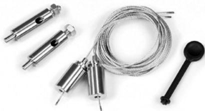
KIT STAINLESS STEEL CABLE 10840

PEÇAS SOBRESSELENTES | PIÈCES DE RECHANGE | SPARE PARTS | PIEZAS DE REPUESTO | ERSATZTEILE | PEZZI DI RICAMBIO | RESERVEONDERDELEN